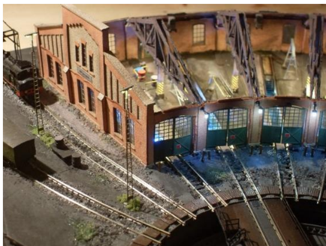
Archistories Lokschuppen mit Gebäudeleuchten und Vorfeldmasten von HOS