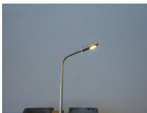
Siedlungsleuchte mit 0402 LED, Bild HOS