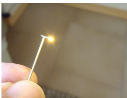
BILD HOS Strassenleuchte, warmweiß, kurzer Ausleger, Bild HOS