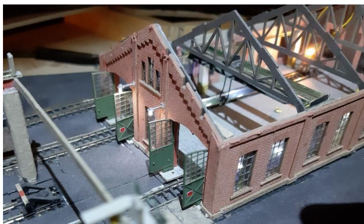
Gebäudeleuchten am Lokschuppen