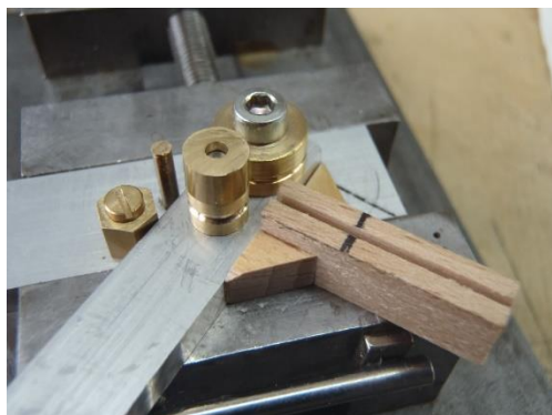
Rohrbiegevorrchtung für die Peitschenleuchten,