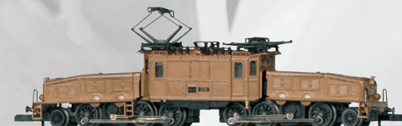
88565 Elektrolokomotive Serie Ce 6/8 III „Krokodil“

Bisherige Modelle der Märklin Z Manufakturmodelle Feinguss Edition: