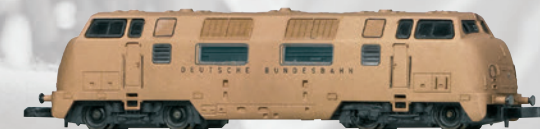
88207 Diesellokomotive Baureihe V 200