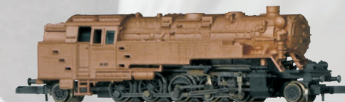
88932 Dampflokomotive BR 85